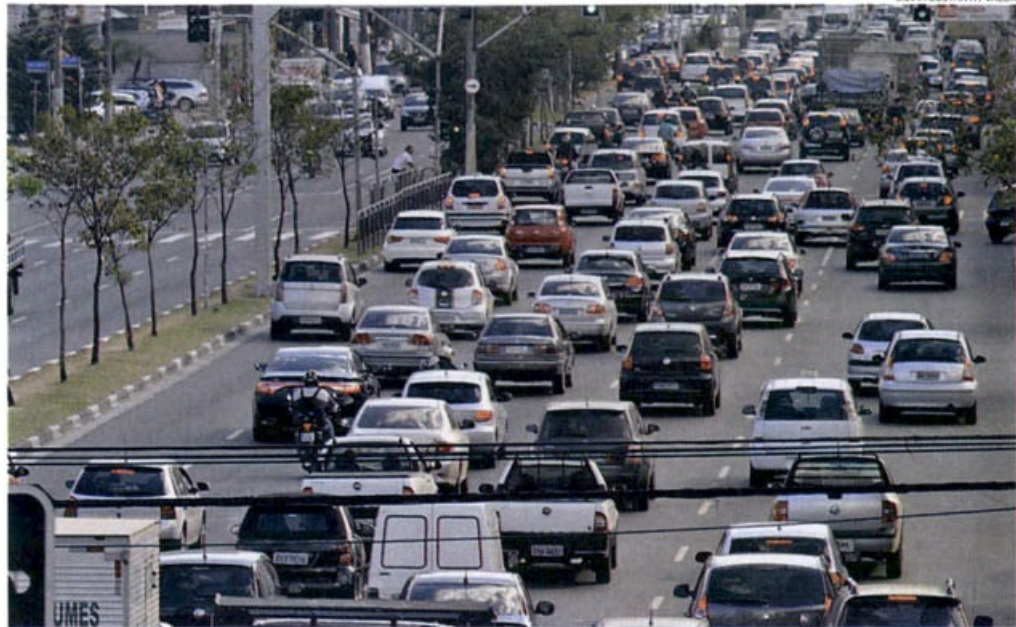
Avenida JK, na cidade de São Paulo: sempre congestionada

tério das Cidades, o principal gargalo aos investimentos é a falta de projetos estruturados a cargo das prefeituras municipais. "A União dispõe de recursos para apoiar cinco ou seis vezes o que temos apoiado. Mais recursos não são liberados devido às deficiências dos projetos", afirma o secretário.